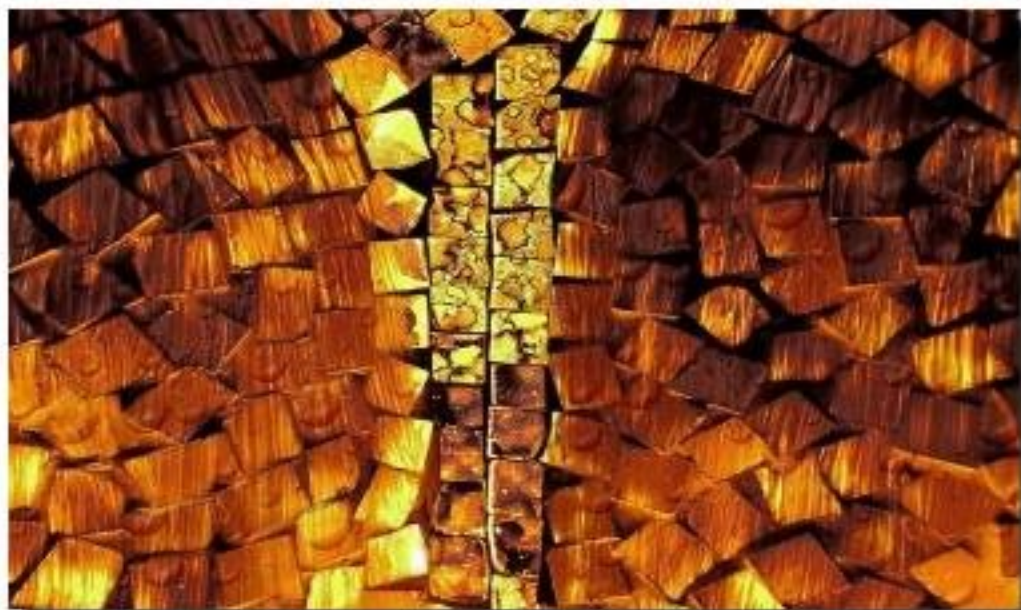
Oeuvre de couverture "Amber Cell" 60x80 Collection "Vision Abstraite - Voyage dans l'inconscient"